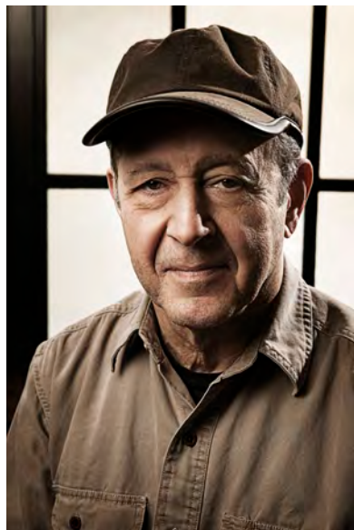
Steve Reich

Coproduction Ircam-Centre Pompidou, Radio France.