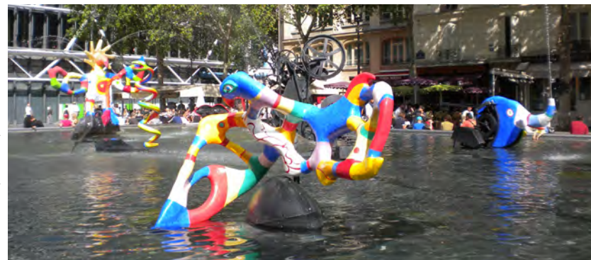
Fontaine Stravinsky

Production Ircam-Centre Pompidou avec le soutien du mécénat d'AXA.