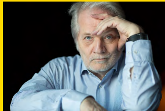
Péter Eötvös