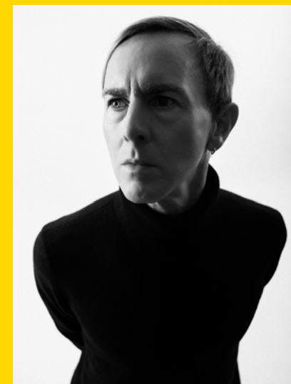
Richie Hawtin aka Plastikman

Production Ircam-Centre Pompidou. En partenariat avec le Centre national de la musique.